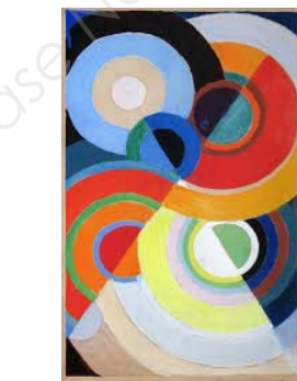
Sonia Delaunay, « Rythme couleur », peinture, 1939