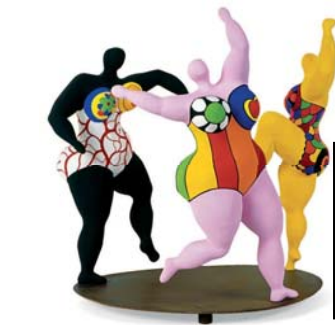
Niki de Saint-Phalle, « Les baigneuses », polyester 1974