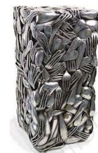
César, « Compression de couverts », métal, 1982