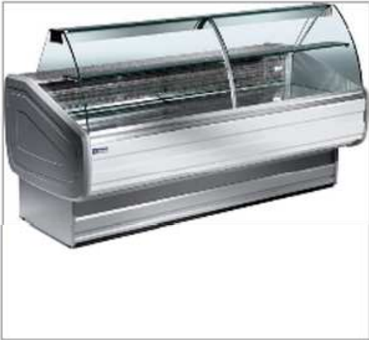
Comptoir vitrine réfrigéré 1m50